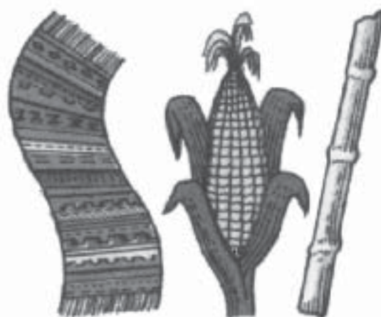
Municipalidad de San Miguel Chicaj, B.V.

La Municipalidad de San Miguel Chicaj saluda a los poetas y escritores del Cantar de las Rosas y a todos los bajaveraspacenses con motivo de la Feria Patronal de San Mateo Apóstol.